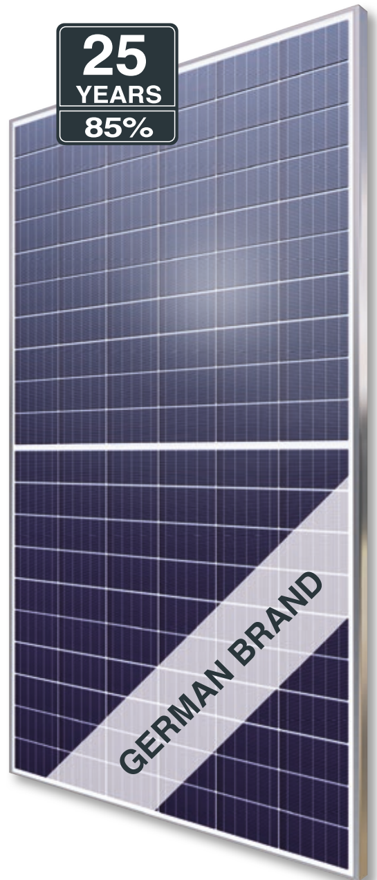
Abb. ähnlich 120MHDE201026A